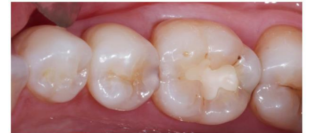
Figure 1—The 31-year-old patient's chief complaint was food entrapment that frequently occurred in the embrasures. Using DEXIS, the composite restoration in tooth No. 20 looked sound, but clinically, using 3.5x magnification (Zeiss), I determined that the marginal integrity of the composite was failing.