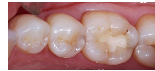
Figure 4—The 21-year-old patient's distal mandibular tooth exhibited new root caries that frequently occurred in the endosseous implant (2005). The composite resin was removed, the 20-year-old patient had already using the regenerative class 1 cement and had the original strength of the composite was better.